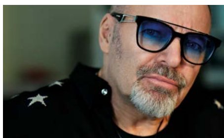
Tre testimonial LOCMAN d'eccezione. In senso orario: Vasco Rossi, Sharon Stone e David Beckham.