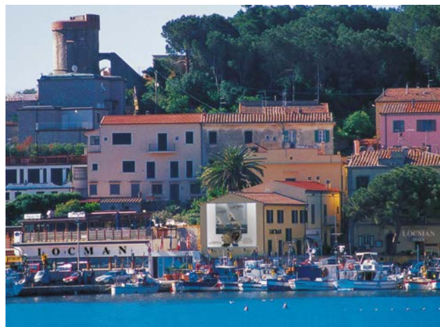
Il quartier generale di LOCMAN, a Marina di Campo.