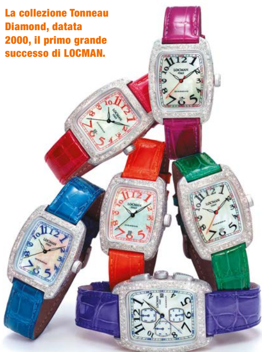
La collezione Tonneau Diamond, datata 2000, il primo grande successo di LOCMAN.

N ei 2003, dopo aver acquistato una partecipazione nella società Materie Future, operante nel settore della ricerca e applicazione di materiali compositi nei settori industriali, LOCMAN presenta a Baselworld la più importante fiera internazionale dell' orologeria, il primo orologio al mondo con cassa in fibra di Carbonio. La produzione LOCMAN in quegli anni si arricchisce di vari brevetti innovativi anche in relazione all' uso di una particolare lega in Titanio, totalmente biocompatibile, con un peso specifico 40 % inferiore all' acciaio e con caratteristiche tecniche eccezionali. Nel 2004 David Beckham viene fotografato alle conferenze stampa con un orologio LOCMAN in Titanio ed il successo si amplia in particolare in Giappone dove LOCMAN apre un proprio punto vendita nel cuore di Ginza a Tokyo. Nel 2005, però, a Mantovani viene diagnosticata una terribile malattia che gli dava pochi mesi di sopravvivenza. La società viene delegata a vari manager e Mantovani comincia un ciclo di cure molto impegnative, che lo porteranno a guarire definitivamente nel 2008.