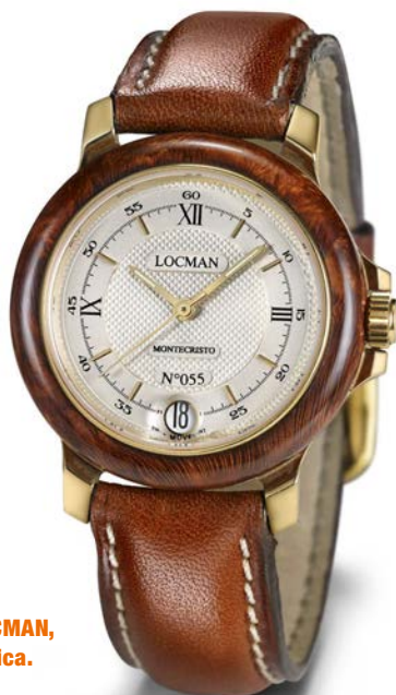
Montecristo, il primo modello a marchio LOCMAN, con cassa in oro e radica.