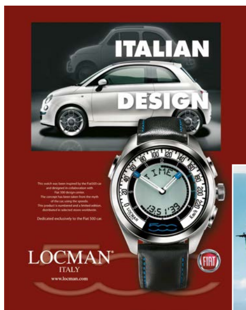
Sopra, l'Edizione Speciale LOCMAN dedicata alla Nuova Fiat 500. A destra, la collezione Tremila Aeronautica Militare.